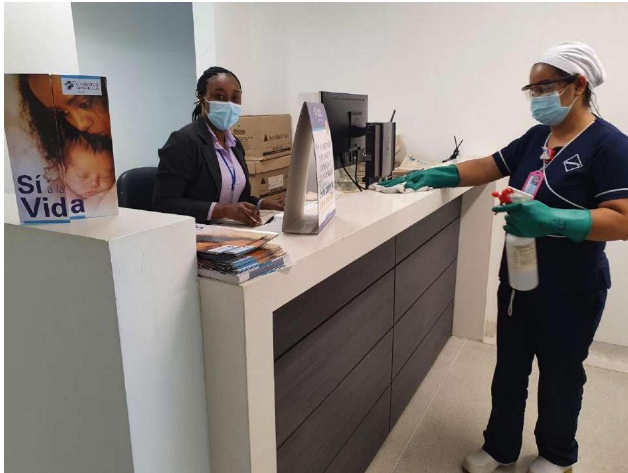
Limpeza y desinfección de las áreas administrativas y asistencia buscando siempre la prevención de CoVid- 19